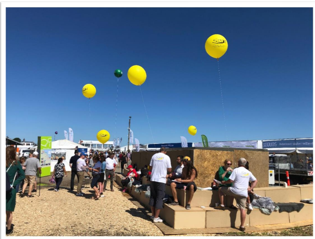
SBH på Folkemødet 2019 med gule heliumballoner svævende på en skyfri himmel ☺

Vores eget arrangement var ift. vores kapacitet rigtigt fint dimensioneret. Noget fakta, vi kunne bringe på Folkemødet, er bl.a., at vi kan dokumentere, at der bor en række udflytningsklare borgere på boformerne. Vi har lige nu data fra ca. 1000 pladser, der viser, at ca. 50 % af borgerne er udflytningsklare med eller uden støtte eller til anden boform. Det, kombineret med, at det er 15 % af borgerne, der ligger på 50 % af pladserne, er det interessante data, der kan danne grundlag for styring og udvikling.